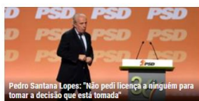
Pedro Santana Lopes: "Não pedi licença a ninguém para tomar a decisão que está tomada"