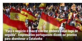
"Para o negócio é mais fácil do que embora aqui logo de seguida". Empresários portugueses dizem-se prontos para abandonar a Catalunha