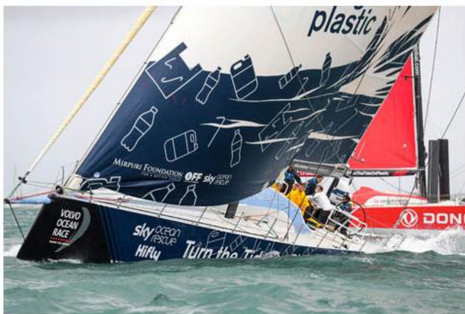
Lisbon. The Mirpuri Foundation In-Port Race. 03 November 2017

"Siamo partiti bene, ma alla boa di bolina eravamo molto lenti e ci siamo trovati in coda alla flotta. Però siamo riusciti a rimontare, passo dopo passo, e all'ultimo giro eravamo nel posto giusto al momento del salto di vento. Abbiamo finito secondi e siamo felici del piazzamento."