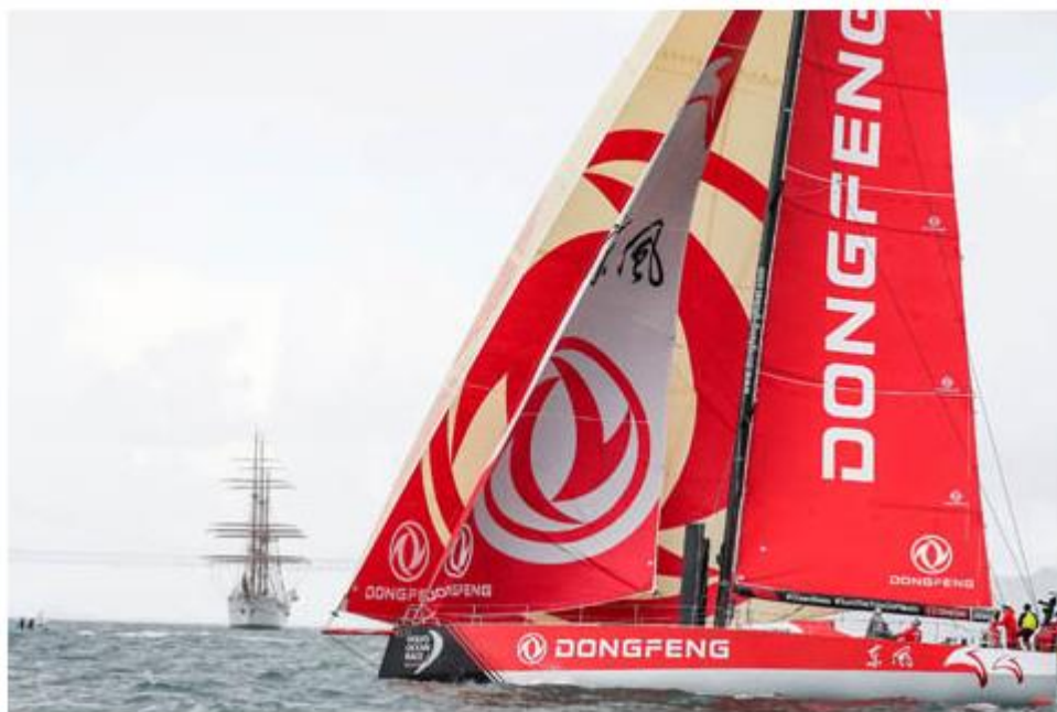
Lisbon. The Mirpuri Foundation In-Port Race. 03 November 2017.

"Il team ha lavorato bene, siamo riusciti a risalire, abbiamo fatto buone manovre anche se da fuori non sembrava. So che abbiamo fatto un buon lavoro." Ha detto lo skipper di Dongfeng Race Team, Charles Caudrelier. "Il terzo posto è ottimo, un buon lavoro."