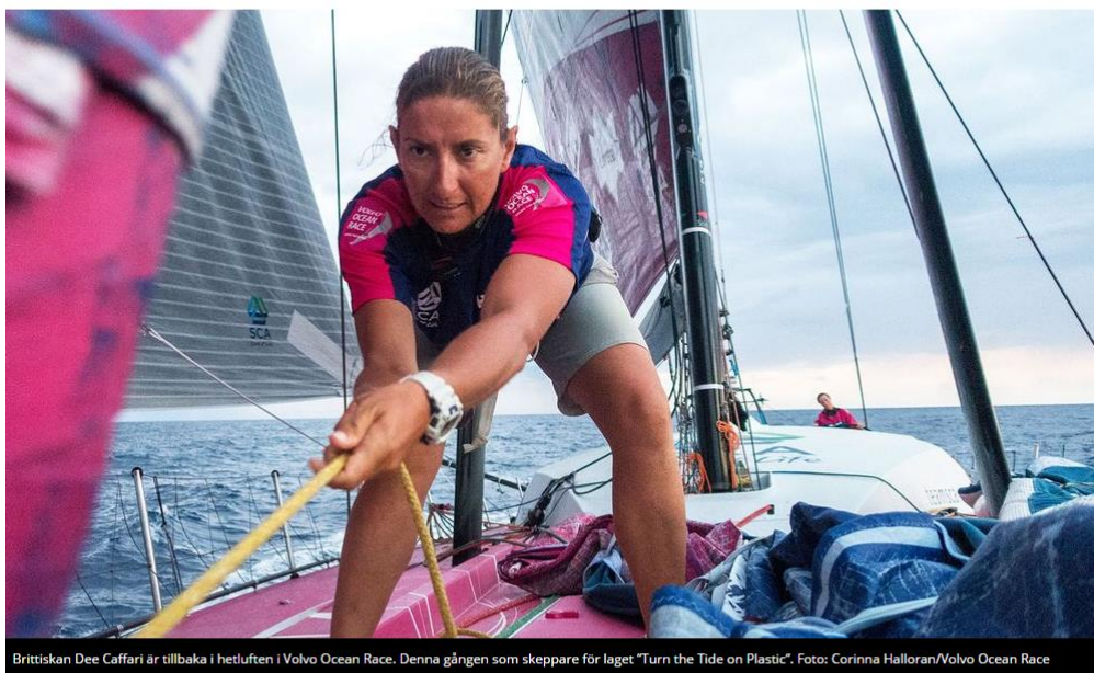
Brittiskan Dee Caffari är tillbaka i hetluften i Volvo Ocean Race. Denna gången som skeppare för laget "Turn the Tide on Plastic".

Brittiskan Dee Caffari axlar skepparrollen för laget "Turn the Tide on Plastic" i VOR 2017-2018.